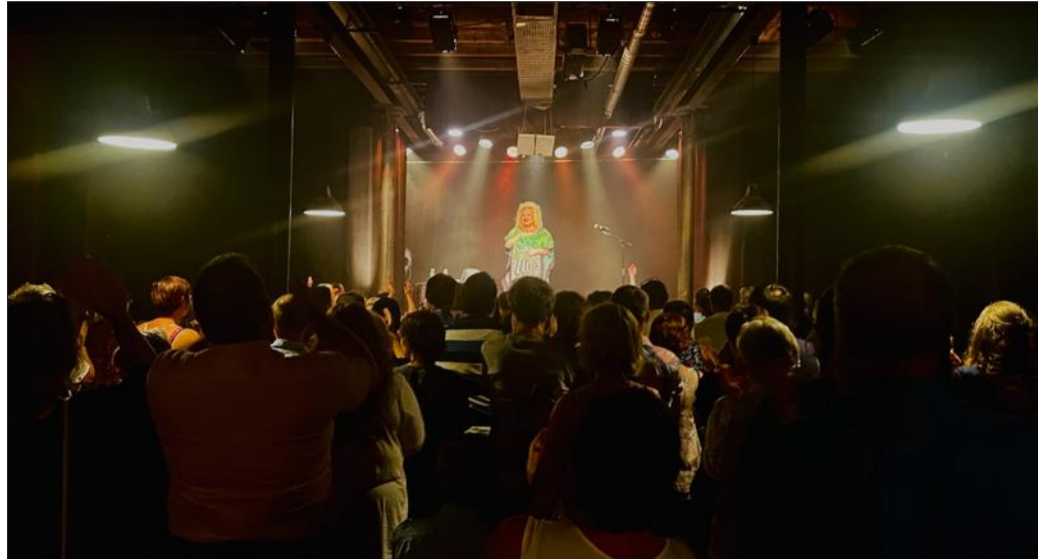
Le théâtre d'humour mulhousien L'Entrepot entame sa rentrée les 16 et 17 septembre.